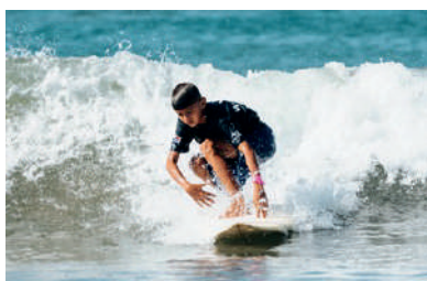
Playa Venao en la 1er Competencia del año