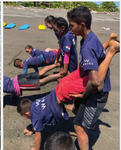
Estudiantes realizando ejercicios de trabajo en equipo