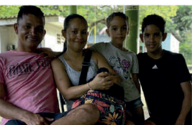
Familia Vera. Padres de Samule y Diana, involucrados en las actividades de sus hijos