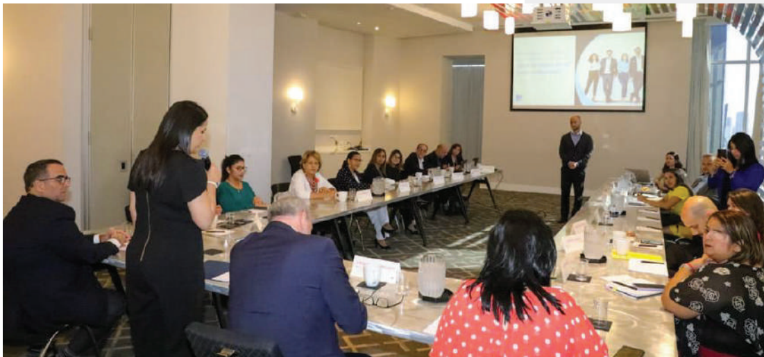
María Inés Castillo, Ministra de Desarrollo Social de Panamá, dirigiéndose a la audiencia presente en la lectura preliminar de los resultados de la encuesta 'Qué se espera de un joven profesional'

During the month of February, the preliminary results were presented to various members of government, educational organizations, companies and national and international chambers of commerce. In addition to new partnerships with the Ministries of Social Development and Labor, the United Nations Educational, Scientific and Cultural Organization (UNESCO) will also joined the organization of the Symposium on June 15 in Panama City.