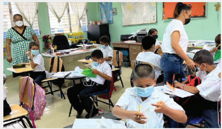
Directora supervisando las actividades en el aula de clases