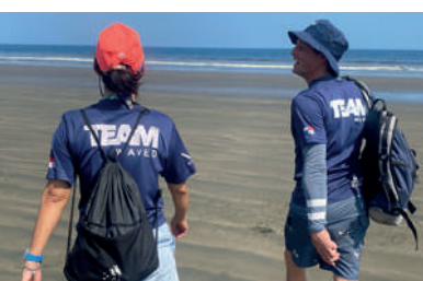
Dos de nuestros arquitectos del TEAM visitando el área de construcción de la Zona - Isla Cañas