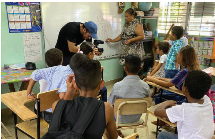
En el aula recibiendo clases con la Directora

La Zona me parece una idea muy interesante, ya que, por ser complementario, refuerza lo que nosotros queremos plasmar en los estudiantes en el día a día. Queremos que sean líderes y por esto, la iniciativa nos parece muy atinada. Será lo máximo para los estudiantes, aprender aún más lo que ya se está organizando por parte de Waved para nuestra Isla. Todos, entre padres, maestros y la comunidad como tal, buscamos hacer un cambio significativo para los estudiantes.