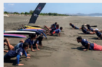
Coaches y estudiantes realizando ejercicios