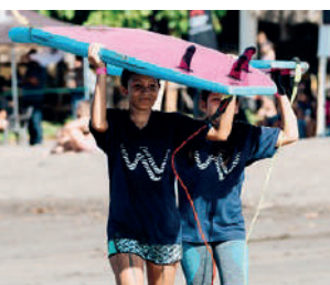
Estudiantes listas para ir a surfear