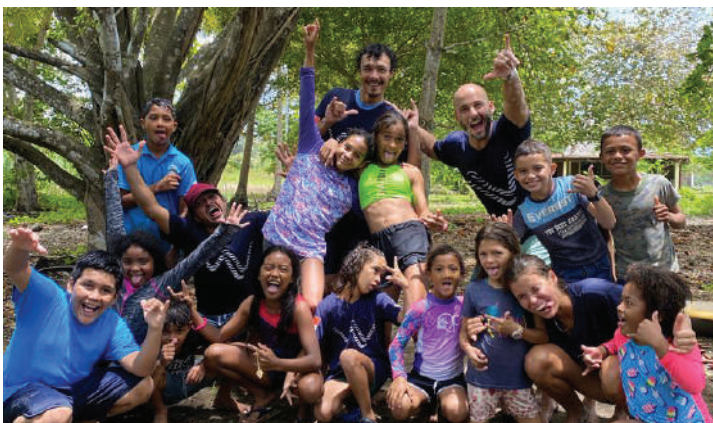
Momento de disfrute entre coaches y estudiantes