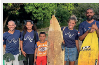
Parte de nuestro TEAM en Isla Cañas