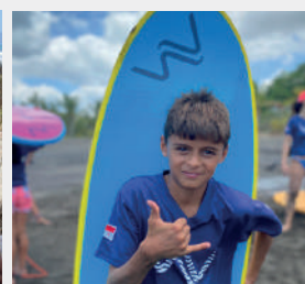
Estudiante feliz con tabla de surf nueva donada por Hotel Sansara