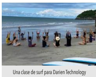
Una clase de surf para Darien Technology