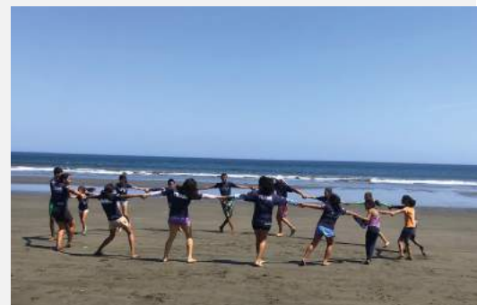
Estudiantes en una actividad en la Zona