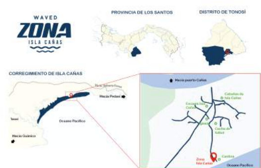
Ubicación geográfica de Zona - Isla Cañas