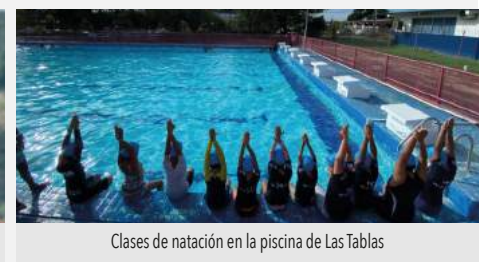
Clases de natación en la piscina de Las Tablas