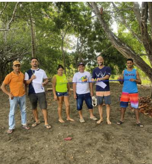
Firma del convenio del terreno de la Zona - Isla Cañas