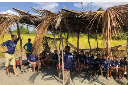
Estudiantes aprendiendo sobre reciclaje y Ocean Safety