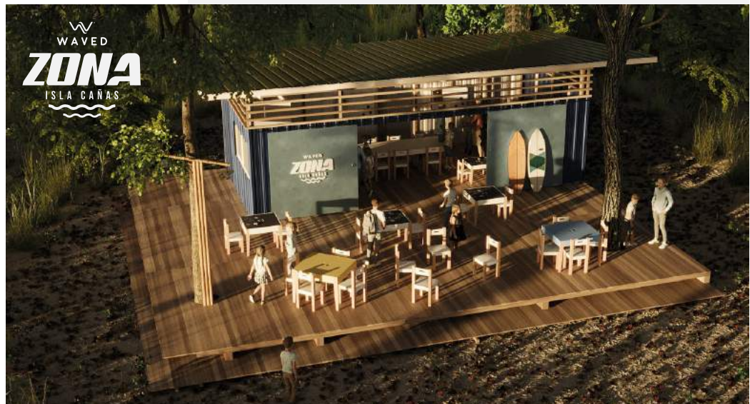
Render de la Zona - Isla Cañas