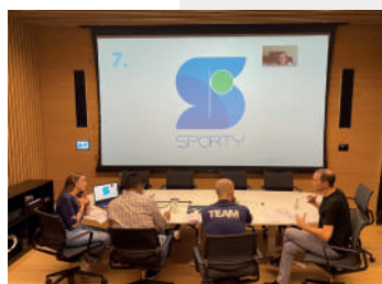
Mesa del jurado debatiendo los logos postulados al concurso un logo para Sporty