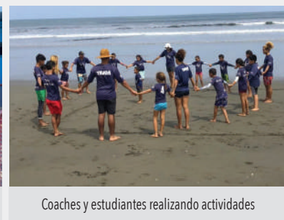
Coaches y estudiantes realizando actividades