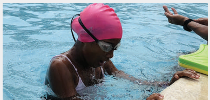
Practicando ejercicios de respiración