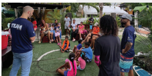
Waved participando en el Open de Popote