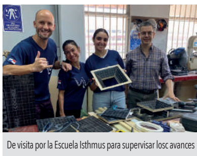
De visita por la Escuela Isthmus para supervisar los avances