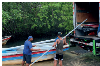
Llegada de materiales a Isla Caña, para dar inicio a la construcción de nuestra primera escuela Zona