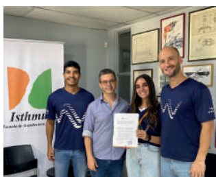
Renovación de alianza con la Escuela de Diseño y arquitectura Isthmus