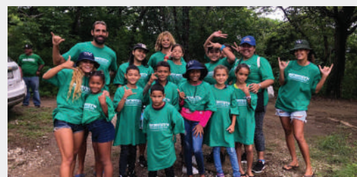
Coaches y estudiantes participando en un evento de reforestación