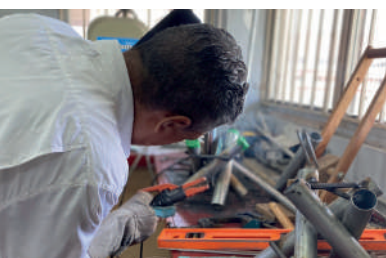
Creación de piezas innovadoras en el Taller de la Escuela Isthmus para la construcción de Zona