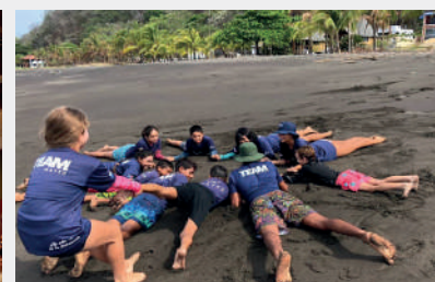
Coaches y estudiantes realizando ejercicios