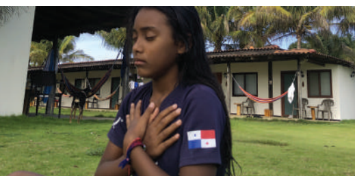
Estudiantes practicando ejercicios de mindfulness