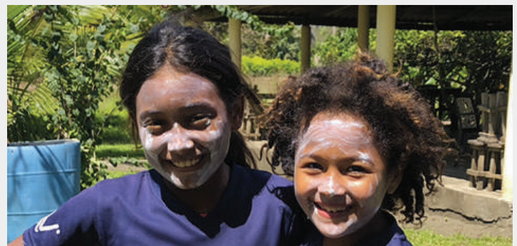
Momento de disfrute y de compartir con otros estudiantes