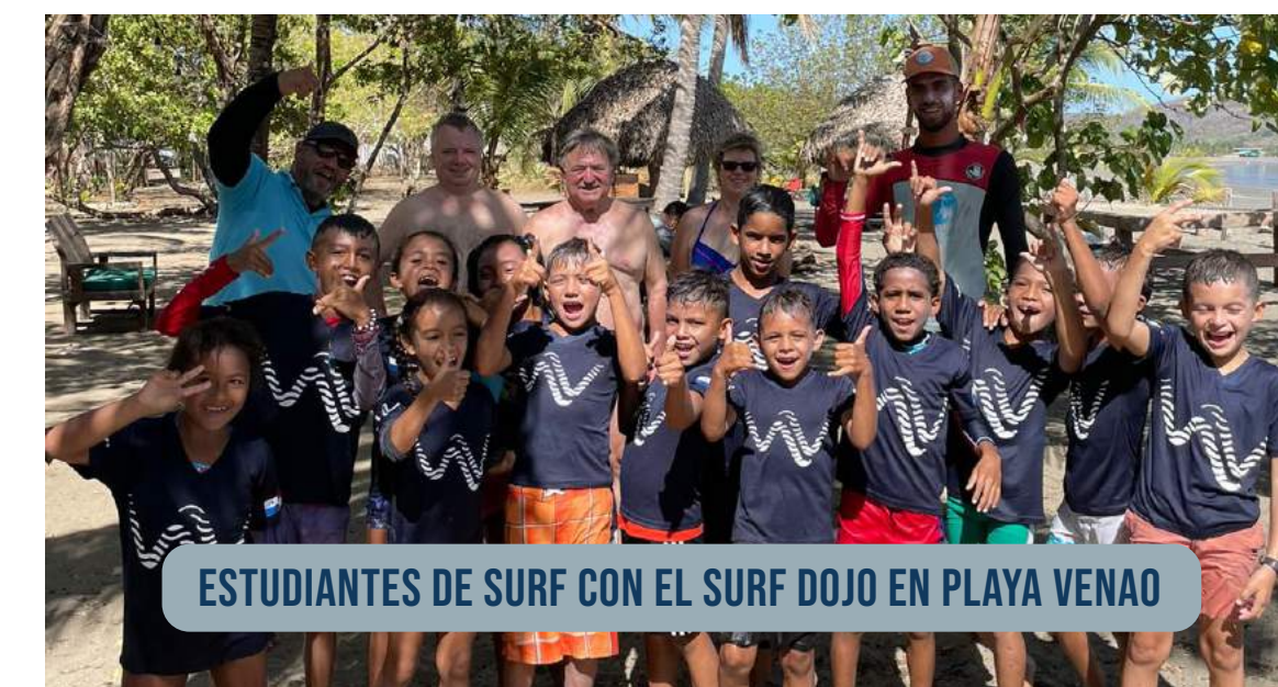
ESTUDIANTES DE SURF CON EL SURF DOJO EN PLAYA VENA