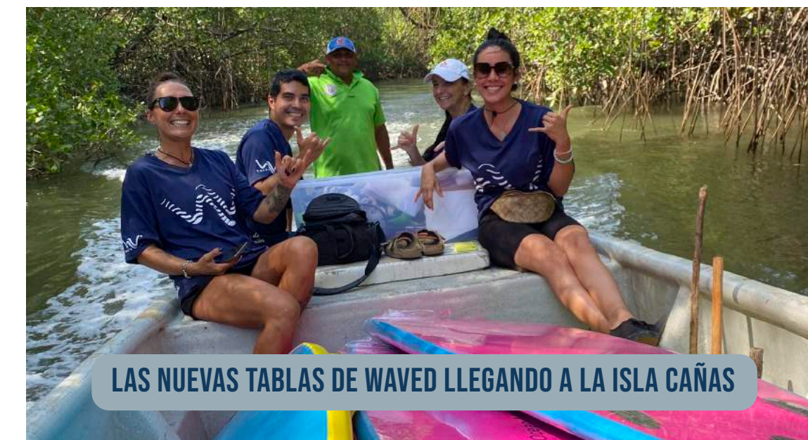
LAS NUEVAS TABLAS DE WAVED LLEGANDO A LA ISLA CAÑAS