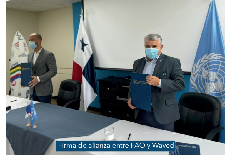
Firma de alianza entre FAO y Waved

La brecha financiera de B / . 27,000 se recolectará, próximamente, a través de un segundo Roadshow. El inicio de la construcción está previsto para el martes 7 de septiembre de este año.