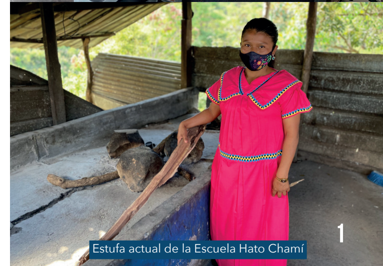
Estufa actual de la Escuela Hato Chamí