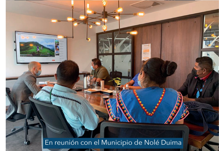
En reunión con el Municipio de Nolú Duima